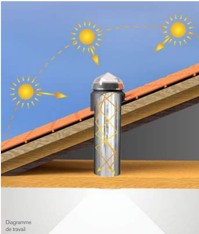
Diagramme de travail