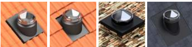
Tuile ondulée (B5)