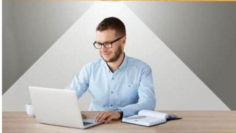
TUBE SOLAIRE PERSA Éclairage continu 24h/24